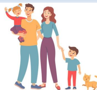
PARCOURS PARENTS 0-10 ANS