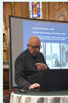
Présentation de l'église Saint Symphorien de Fondettes par l'Association Fundeta