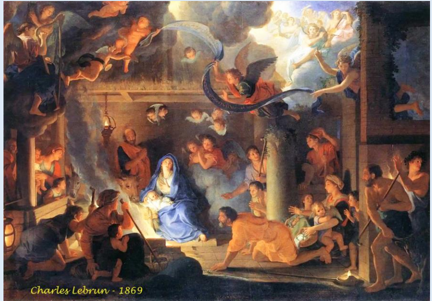
Charles Lebrun - 1869

Toute naissance ouvre une période nouvelle, espérée heureuse, ouvre un monde nouveau, promesse de bonheur