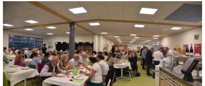
Après la cérémonie, Un repas partagé a réuni les diacres, leurs épouses et amis au Collège Jean XXIII de Fondettes